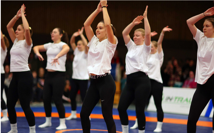
Auftritt der Tanzgruppe „Unexpected“ des TV Wurmlingen

Auch in dieser Saison dürfen sich unsere Zuschauer wieder auf ein abwechslungsreiches Rahmenprogramm freuen. Besonders freuen wir uns, dass die Tanzgruppe „Unexpected“ erneut mit dem ein oder anderen Auftritt für Stimmung in der Halle sorgen wird. Lasst euch überraschen – es lohnt sich!